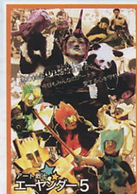
アート戦士エーヤンダー5